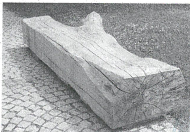
příklad lavice z opracovaného kmene