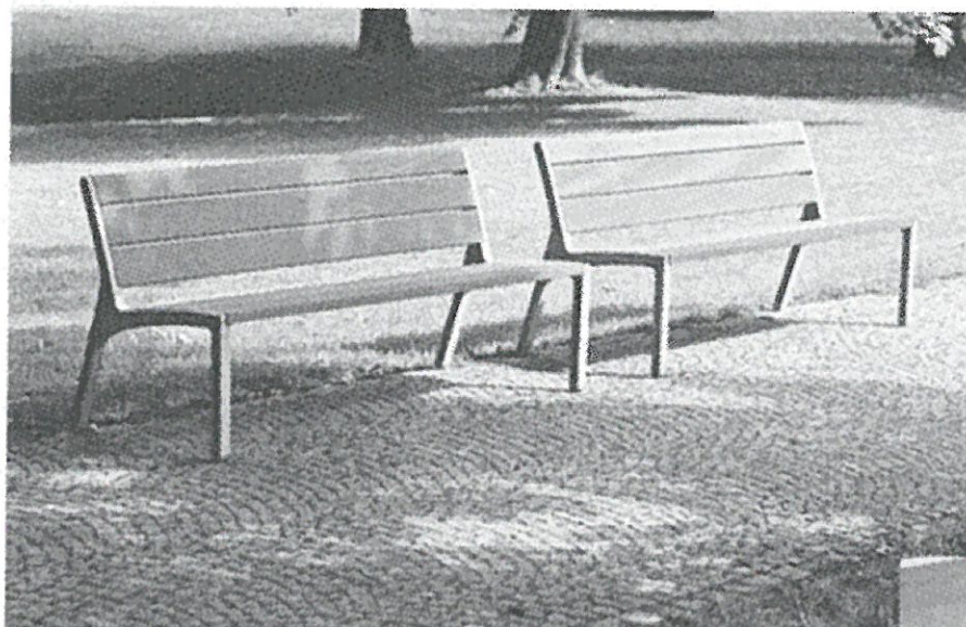
lavička kov + dřevo, sedák i opěradlo z desek z masivního dřeva