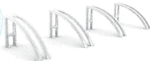
stožan na kola, instalace po jednotlivých segmentech